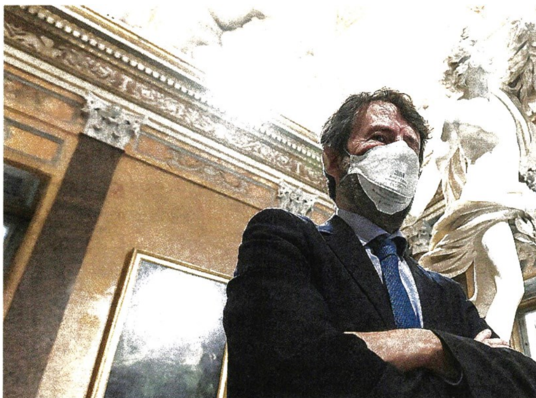
Roma Dario Franceschini , 62 anni, ministro dem della Cultura, alla Galleria Borghese per la mostra di Damien Hirst