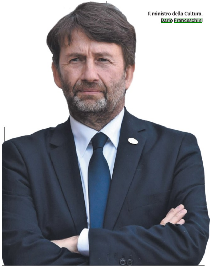
Il ministro della Cultura, Dario Franceschini

La crisi pandemica ha dato piena consapevolezza di quanto ci sia da investire nella digitalizzazione del nostro patrimonio culturale, quanto debba e possa essere reso fruibile da tutti e quanto vada migliorata l'offerta digitale dei nostri musei. Su questo stiamo già lavorando e abbiamo proposto un piano specifico all'interno Next Generation EU. Poi occorrerà investire per rendere più accogliente il nostro Paese, migliorando le infrastrutture di mobilità per permettere al turismo internazionale di raggiungere posti straordinari oggi difficilmente visitabili, modernizzando le strutture di accoglienza, promuovendo le eccezionali bellezze delle aree interne. Il turismo intenzionale tornerà più impetuoso di prima, dobbiamo prepararci per governarlo.